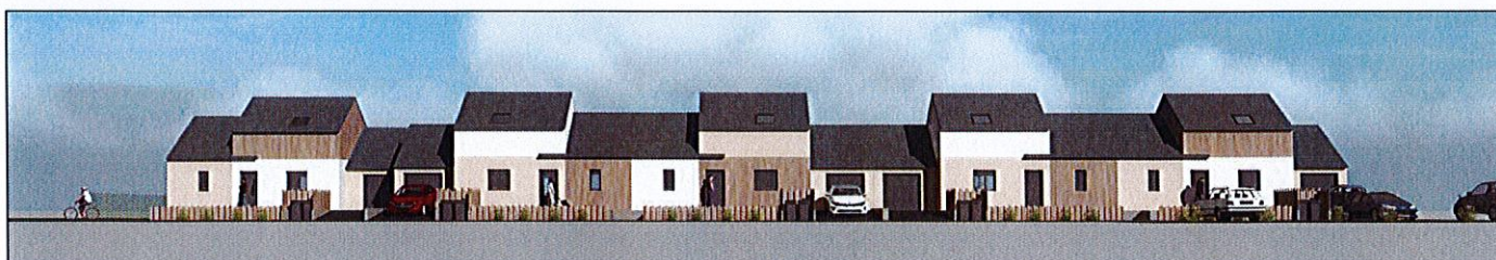
FAÇADES SUR RUE