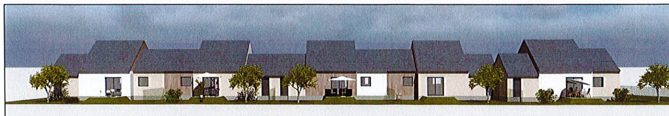
FAÇADES SUR JARDINS