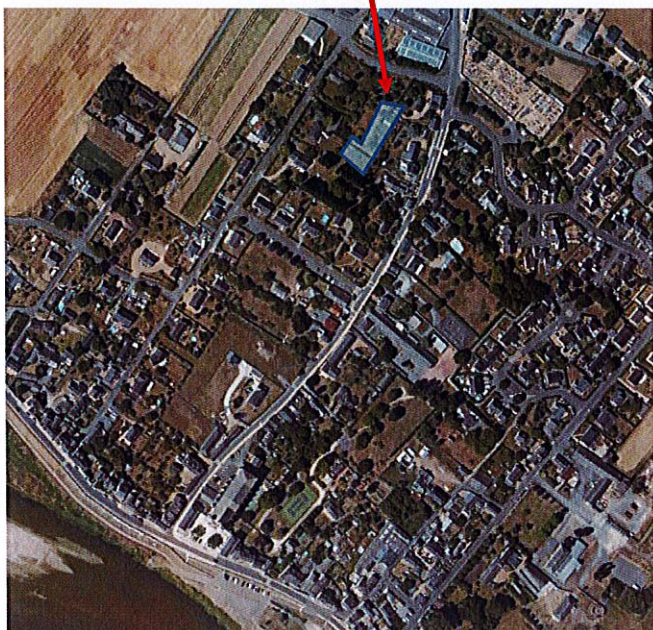
Localisation de l'opération