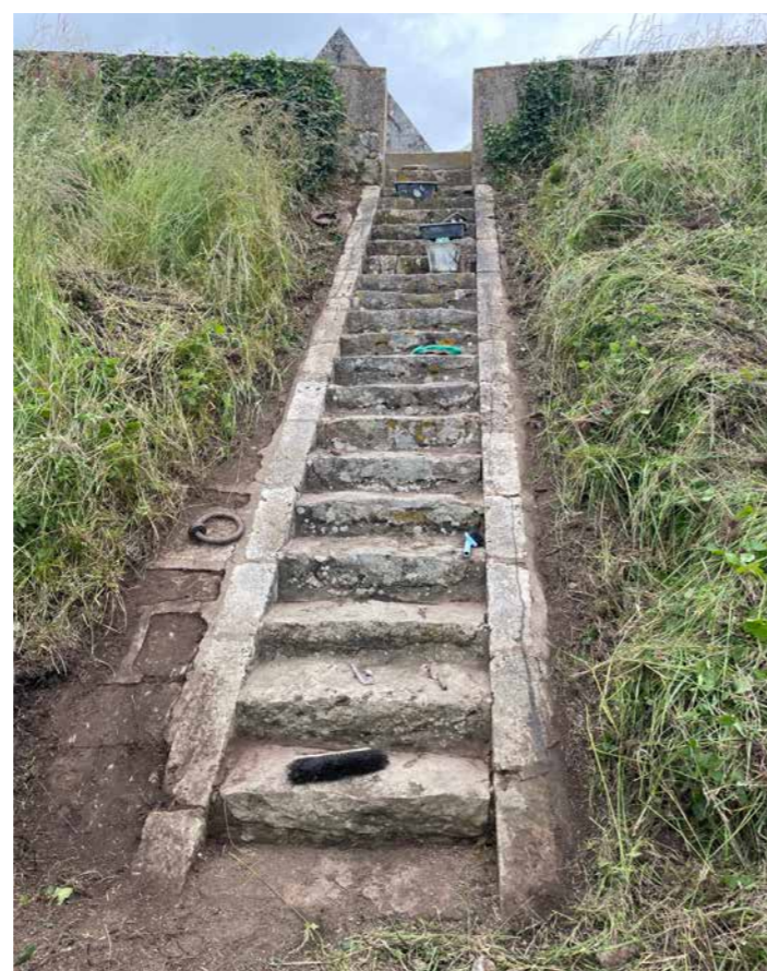
Le résultat final